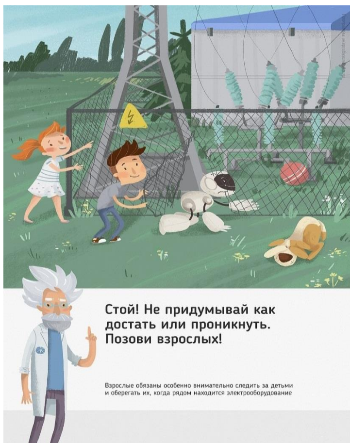
Рис. 5 Стой! Не придумывай как достать или проникнуть. Позови взрослых!