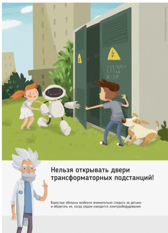
Рис.1 Нельзя открывать двери трансформаторных подстанций

Ежегодно энергетики проводят для школьников познавательные уроки, конкурсы рисунков и историй на тему электричества и правильного с ним обращения. Но работы одних энергетиков в данном направлении недостаточно, для полного понимания проблем электробезопасности нужен пример общества, в котором растет ребенок, и, конечно же, главным образом родителей. Эта работа приносит свои результаты: электротравмы на энергетических объектах единичные, и каждый случай становится поводом для служебной проверки. Но только технических мер мало для того, чтобы полностью обезопасить детей. Им нужен пример родителей.