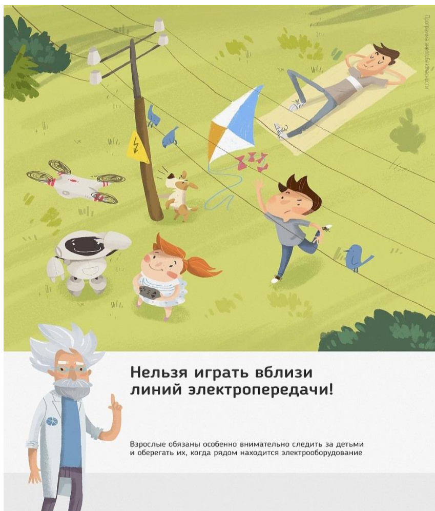
Рис.3 Нельзя играть вблизи линий электропередачи