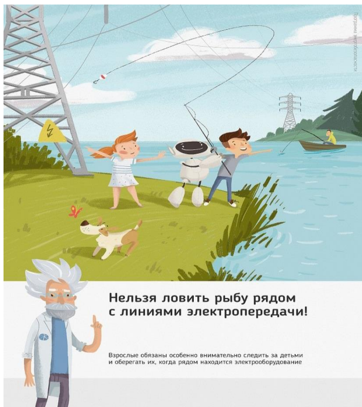
Рис. 4 Нельзя ловить рыбу рядом с линиями электропередачи

Об открытых подстанциях, оборванных проводах нужно сообщить в Кубанское ПМЭС по телефону 8-861-219-40-20 или позвонить на единый телефон всех экстренных служб 112.