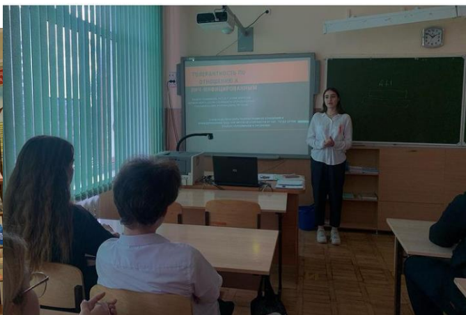
Анкетирование старшеклассников и педагогов